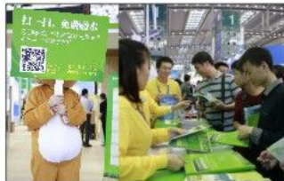
扫二维码送矿泉水、盖章领礼品等活动，让展区人气持续爆棚

在主题展区的“绿色之家”，组织单位举办了多场专家面对面活动，还创意地推出了为展位免费提供的增值服务活动——“绿色建筑产品推介秀”，将各参展企业的产品通过模特走秀的方式展示，得到现场观众的