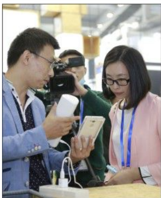
媒体争相对My air空气检测仪进行报道