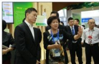
深圳市委副书记戴北方(左)听工作人员介绍“绿色之家”

绿色建筑主题展契合了本届高交会“加快绿色发展”的主题，得到了深圳市委市政府的支持与鼓励。深圳市委常委、副市长张文，深圳市委副书记戴北方莅临现场视察。