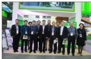
深圳市住房和建设局领导组团到展区参观指导

绿色建筑主题展契合了本届高交会“加快绿色发展”的主题，得到了深圳市委市政府的支持与鼓励。深圳市委常委、副市长张文，深圳市委副书记戴北方莅临现场视察。