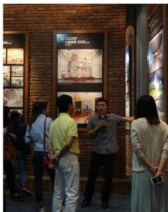
蒙娜丽莎集团将文化艺术与瓷砖完美融合,瓷艺展厅里的作品精美绝伦,栩栩如生

健身进行高效整合:上午前往佛山市西樵镇蒙娜丽莎集团总部,参观蒙娜丽莎文化艺术馆、新型材料生产线、瓷艺展厅等地点,零距离观摩陶瓷艺术与绿色建材的完美融合;下午攀登广东四大名山之一的西樵山,游览南海观音文化苑、白云洞、桃花园等景点,领略大自然的鬼斧神工和壮丽的人文景观;中途欣赏西樵的骄傲,民族的光荣——黄飞鸿狮艺武术表演。