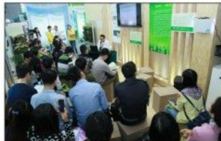
品牌活动“专家面对面”依然受到专业人员的追捧

在主题展区的“绿色之家”，组织单位举办了多场专家面对面活动，还创意地推出了为展位免费提供的增值服务活动——“绿色建筑产品推介秀”，将各参展企业的产品通过模特走秀的方式展示，得到现场观众的