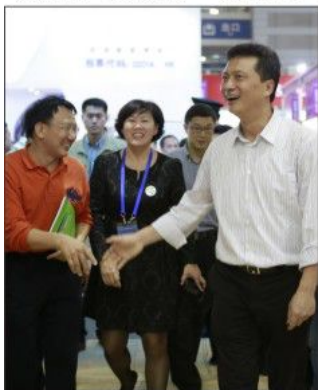
深圳市委常委、副市长张文(右)到展区参观。