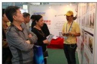
科瑞福旧墙翻新现场收获订单多多

本届绿色建筑主题展企业展区汇聚39家参展企业，其中35家拥有独立展位，包括深圳建科院、中节能索乐图、绿光纳米、中邦集团、邦悦科技、均益安联、安联环保、中城绿建、宝德盛、龙富华、爱绿地、恩麦