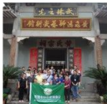
黄飞鸿狮艺武术表演,大家不住拍案叫好