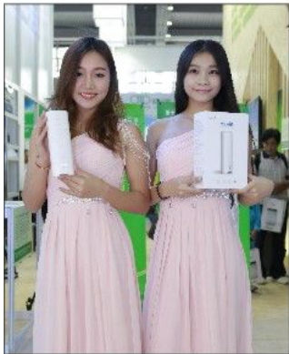
绿色建筑产品推介秀