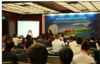
展览同期协会主办的“室内环境与健康呼吸高层论坛”

本届绿色建筑主题展在展会期间组织了丰富多彩的现场活动。主题展期间举办了室内环境与健康呼吸高层