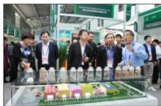
中城绿建城市垃圾处理项目得到关注与推广

本届绿色建筑主题展企业展区汇聚39家参展企业，其中35家拥有独立展位，包括深圳建科院、中节能索乐图、绿光纳米、中邦集团、邦悦科技、均益安联、安联环保、中城绿建、宝德盛、龙富华、爱绿地、恩麦